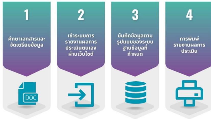
ภาพที่ 7.1 การรายงานผลการประเมินตนเองผ่านระบบออนไลน์